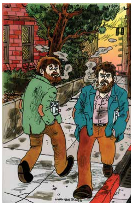
Dessin inédit © Noah Van Sciver