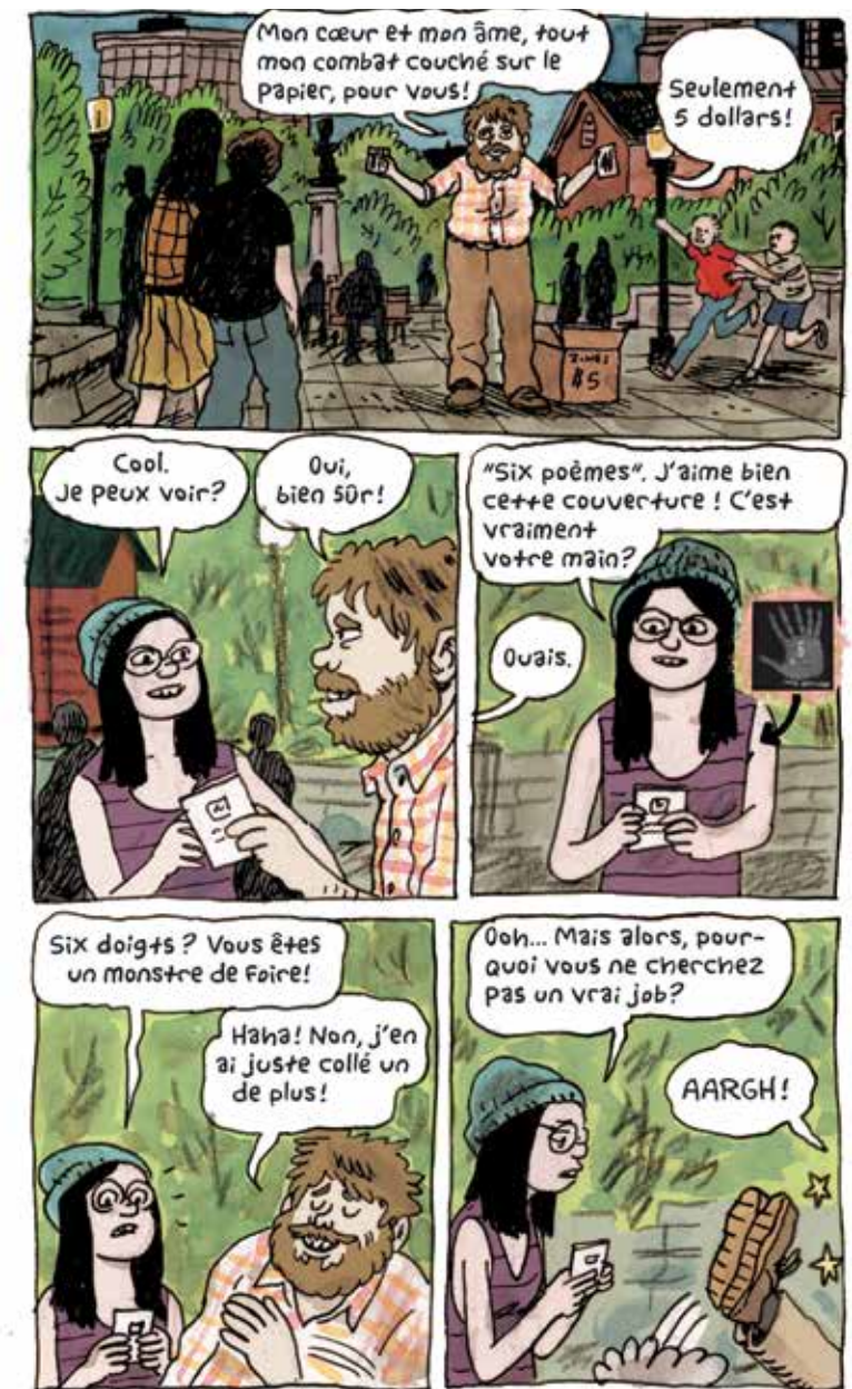
Extrait de Fante Bukowski, l'œuvre complète © Noah Van Sciver / L'Employé du Moi

Est-ce très américain, à votre avis, comme posture ?