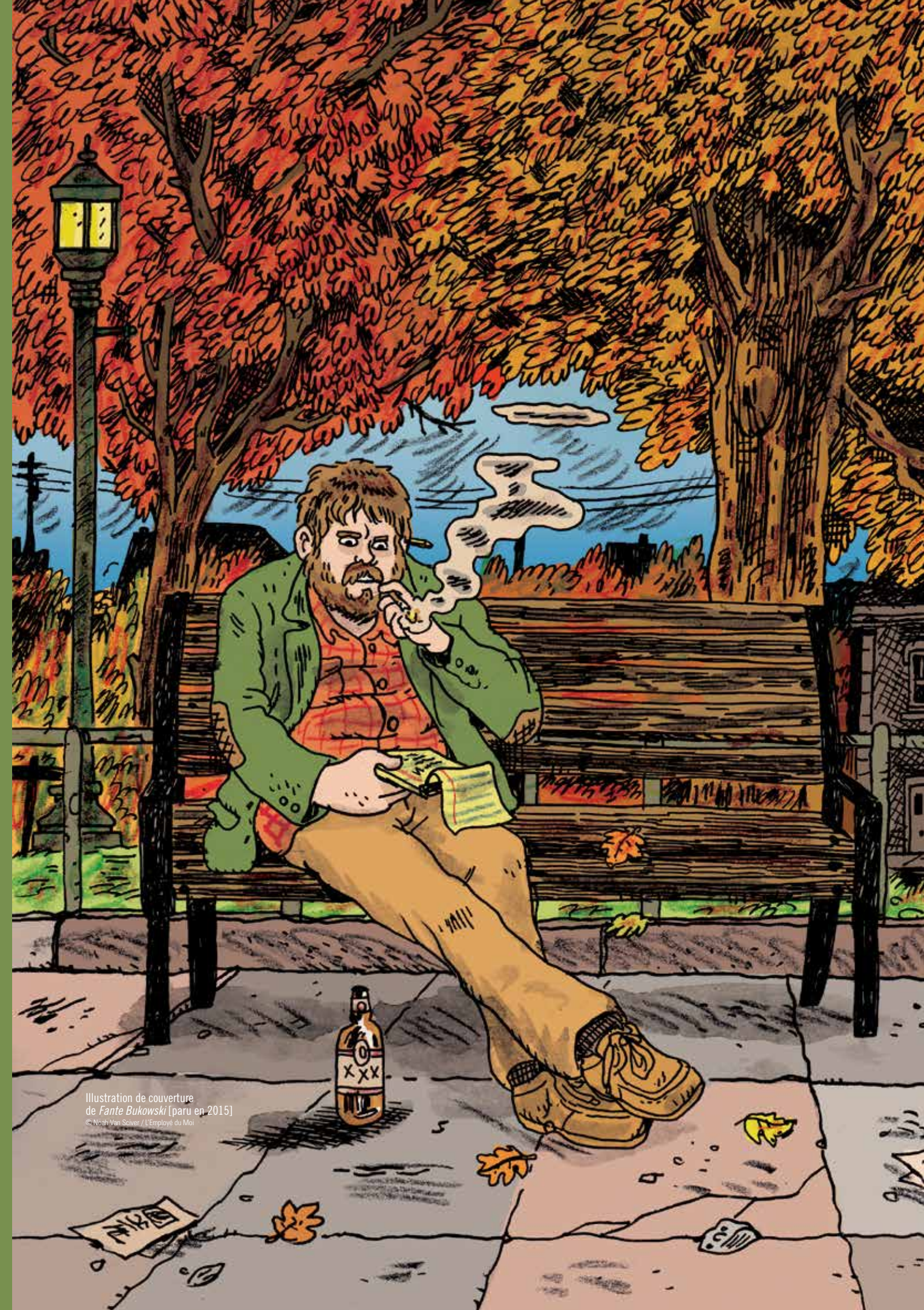
Illustration de couverture de Fante Bukowski (paru en 2015)