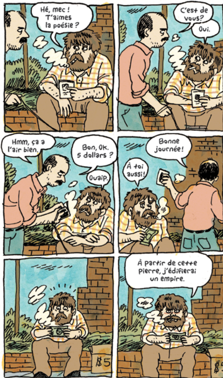
Une planche extraite de Fante Bukowski, l'œuvre complète

Oh oui, les comics et l'histoire des comics sont très importants à mes yeux. J'ai lu un jour une citation d'Art Spiegelman qui disait : « Le futur du comics se trouve dans son passé. » J'ai beaucoup pensé à cette citation depuis. J'ai réalisé que si je voulais devenir un auteur de graphic novels compétent, je devais revenir en arrière et apprendre, autant que possible, tout ce que je pouvais sur l'histoire de ce média et lire ce qui avait été fait avant moi. Et effectivement, tout en dessinant Fante Bukowski , j'ai adoré parsemer l'album de petits clin d'œil chaque fois que je le pouvais. Des choses que seuls les autres fans de comics pourraient comprendre. Cette page en forme d'hommage au « Keep on trucking » de Robert Crumb dont vous parlez m'a particulièrement amusé.